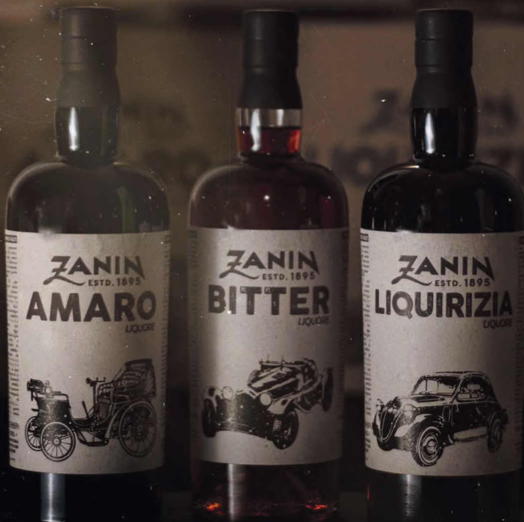
Amaro Zanin 30% vol. - 0,7L